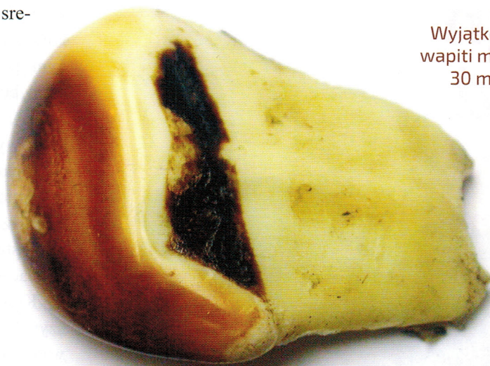
Wyjątkowe okazy grandli jelenia wapiti mogą przekroczyć długość 30 mm. Okaz z kolekcji Adama Matyjaszczyka.