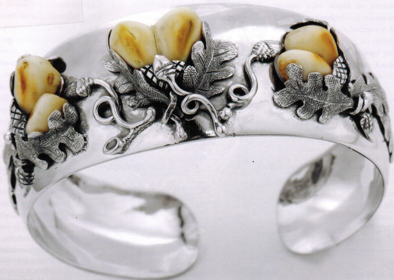
Srebrna bransoleta zdobiona grandlami.